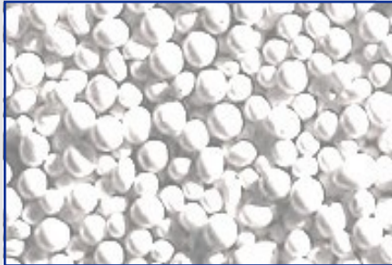
Keramikstrahlmittel „Zirblast“ Art.-Nr. 42109xxx