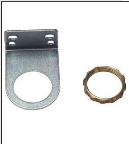
Fastening Angle For Maintenance Units Item-No.: WHM300000000