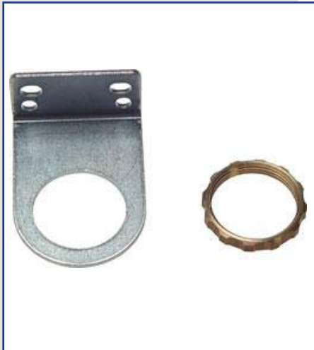
Befestigungswinkel für Wartungsgeräte Art.-Nr.: WHM300000000