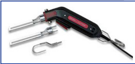
Styroporschneider - Engel-Cutter Artikel-Nr.: 811140200011